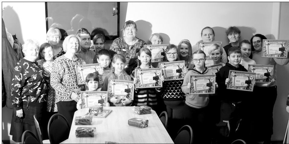
■ Небольшая группа участников проекта сезона 2021-22 гг. п.Каменоломни

ПРИ ПОДДЕРЖКЕ ФОНДА ПРЕЗИДЕНТСКИХ ГРАНТОВ